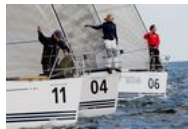
Det fortalte Dansk Sejlunion til Skatteudvalget

Hvad der tidligere var et rum fyldt af radioudstyr i Lyngby Radios lokaler i Bagsværd er i dag erstattet af almindelige computere med forbindelse til et særligt WAN-netværk.